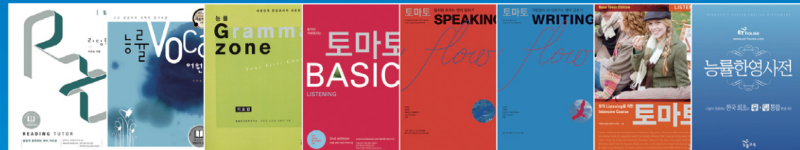
리딩튜터 능률 VOCA Grammar zone 토마토 베이직 토마토 Speaking 토마토 Writing 토마토 INTENSIVE 능률한영사전

열 권의 평범한 교재보다는 한 권의 뛰어난 교재를 만든다! 능률교육이 당신의 꿈 과 함께 합니다.